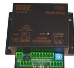
SafePro Web Plus (T093).